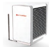
Evaporatore per montaggio a parete HM-HPS60-W ( 8kW) HM-HPS80-W ( 12kW)