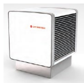
Evaporatore esterno indipendente HM-HPS60 ( 8 kW) HM-HPS80 ( 12 kW) HM-HPS120 ( 20 kW)