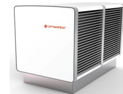
Evaporatore esterno indipendente HM-HPS240 ( 30 kW) HM-HPS240 ( 40 kW) HM-HPS300 ( 55 kW)