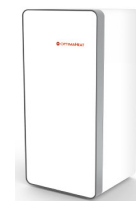
Unità interna: HM-S30L-M-Solid HM-S40L-M-Solid HM-S55L-M-Solid