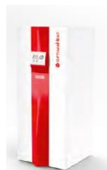
Unità interna: HM-HP08L-M-BC HM-HP12L-M-BC HM-HP20L-M-BC

* In opzione, il condotto di aspirazione può essere progettato con 2 x 22 mm