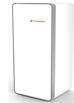
Inneneinheit: HM-S30L-M-Solid HM-S40L-M-Solid HM-S55L-M-Solid