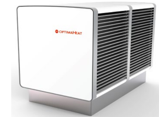
Aussenverdampfer freistehend HM-HPS240 ( 30 kW) HM-HPS240 ( 40 kW) HM-HPS300 ( 55 kW)