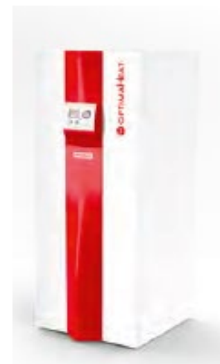
Inneneinheit: HM-HP08L-M-BC HM-HP12L-M-BC HM-HP20L-M-BC

* optional kann die Saugleitung mit 2 x 22 mm ausgeführt werden