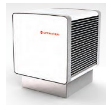
Aussenverdampfer freistehend HM-HPS60 ( 8 kW) HM-HPS80 ( 12 kW) HM-HPS120 ( 20 kW)