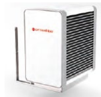
Verdampfer für Wandmontage HM-HPS60-W ( 8kW) HM-HPS80-W ( 12kW)