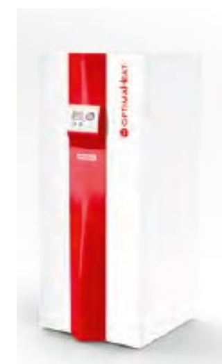
Unité intérieure: HM-HP08L-M-BC HM-HP12L-M-BC HM-HP20L-M-BC