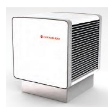
Evaporateur posé à l'extérieur placé librement HM-HPS60 ( 8 kW) HM-HPS80 ( 12 kW) HM-HPS120 ( 20 kW)