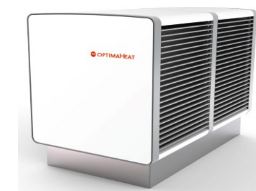
Evaporateur pose à l'extérieur placé librement HM-HPS240 ( 30 kW) HM-HPS240 ( 40 kW) HM-HPS300 ( 55 kW)