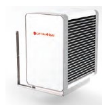
Evaporateur posé à l'extérieur monté sur mur HM-HPS60-W ( 8kW) HM-HPS80-W ( 12kW)