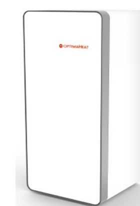
Unité intérieure: HM-S30L-M-Solid HM-S40L-M-Solid HM-S55L-M-Solid